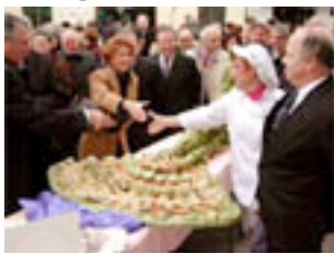
Sopa, bunyols, fricandó, saltat, postres...Déu ni dó.