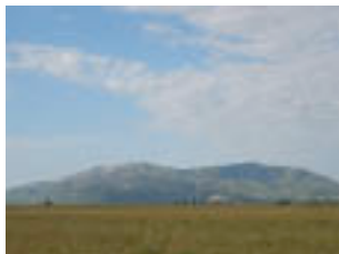
El Montsià ens és bastió i és el nom de la regió.