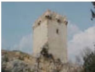
Muralles, torres, castell... és part de l'antic o vell.