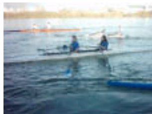
Quan venen les remeres a l'Ebre s'hi fan carreres.