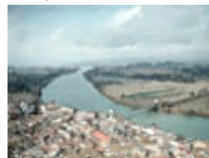
És cruïlla de camins : nord i sud, delta i endins.