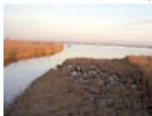
Hi ha un riu ample i cabalós, que té un delta un xic fangós.