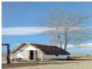
Al delta diem "barraca", a la casa la més maca,