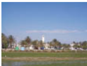
Cultivem per aquí arrós del bo i millor, de bon tros.