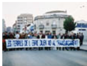
Molts ens el volen xuclar. Ni amb bombes. Es ben clar.