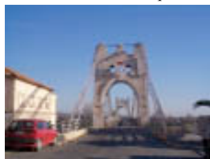
Gràcies al seu Pont Penjant travessa l'Ebre el marxant.