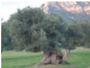
Mil.lenàries oliveres, en les terres secaneres.