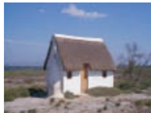
és coberta de borró, allí dins, ni fred ni calor.