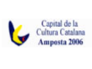
Capital de la Cultura Catalana i no s'atura !