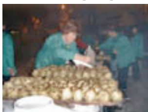
Trobada senyalada és nostra carxofada.