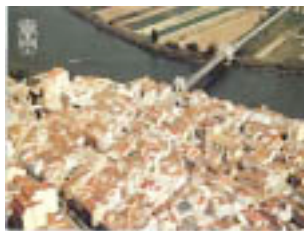
Tindrà tot el 2006, un títol gran i precis :