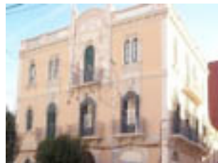
Aquí el gran art modernista pot omplir tot una llista.