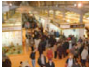
A la gran Fira Amposta molta gent avui s'hi acosta.