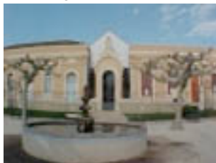
Al Museu del Montsià, és molt bell tot el que hi ha.