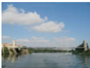
Significa, hom ho diu : « Posada a sobre del riu »