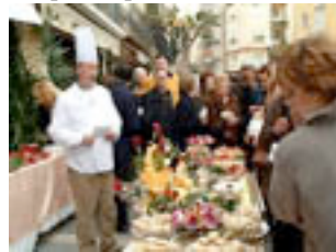
Els ampostins, bons cuiners, amb carxofes fan...diners.