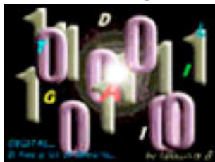
Ja som « Ciutat Digital » i avui dia això és vital.