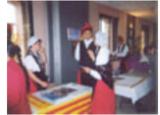
12. Al Cercle dels Joves hi ha un bullit que fa frisar.