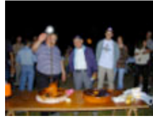
15. Arreu seràs convidat i no hi mancarà el cremat.