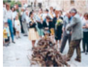
11. El Rosselló com es mou. Cada vila fa enrenou.