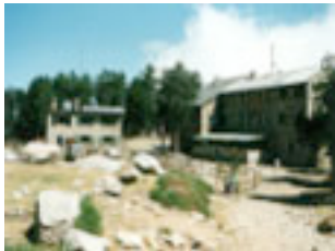
17. De matí hauràs de pujar si no vols bufar i suar.