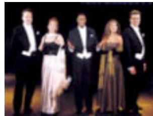
10. També ve de La Bisbal una cobla que s'ho val.