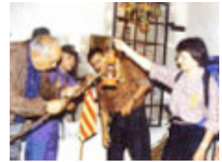
La flama, avui, té un "pacha" l'Iglesis de Perpinyà.