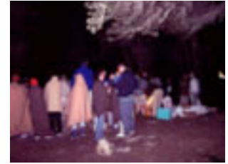
Porrons de vi i molta gresca. L'endemà sols aigua fresca.