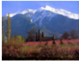
2... des del cim del Canigó fins al més petit racó.