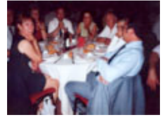
8. En el sopar del Congrés s'entaulen sis cents o més.