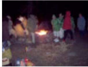
14. El vespre de la Trobada tindràs per menjar l'ollada.