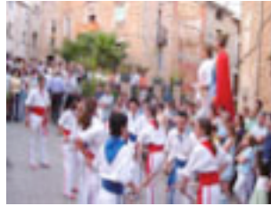
Sardanes , castells, bastons, gegants de Picamoixons...