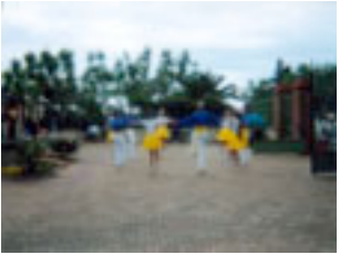
5. El Congrés és formidable, festa grossa, què diable!