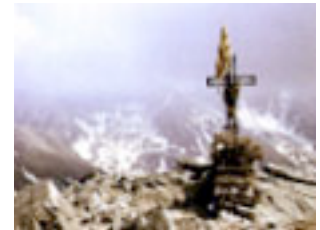
20. La senyera per pendó duu la creu del Canigó.