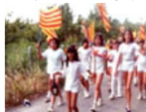
23. I escampa arreu del país aquell foc que el fa feliç