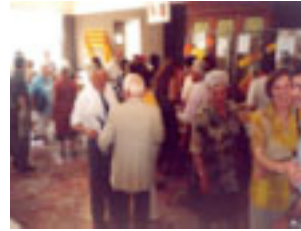
7. Dels Països Catalans ve la gent com bons germans