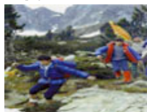
22. El jovent de Perpinyà corre de la Pica al pla.