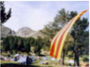
13. Fins a dalt, als Cortalets anem-hi amb colla, vailets.